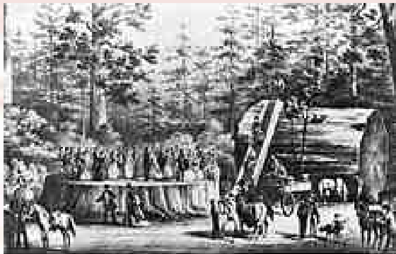
THE STUMP AND TRUNK OF THE MAMMOTH TREE As they stand near the base of the tree.