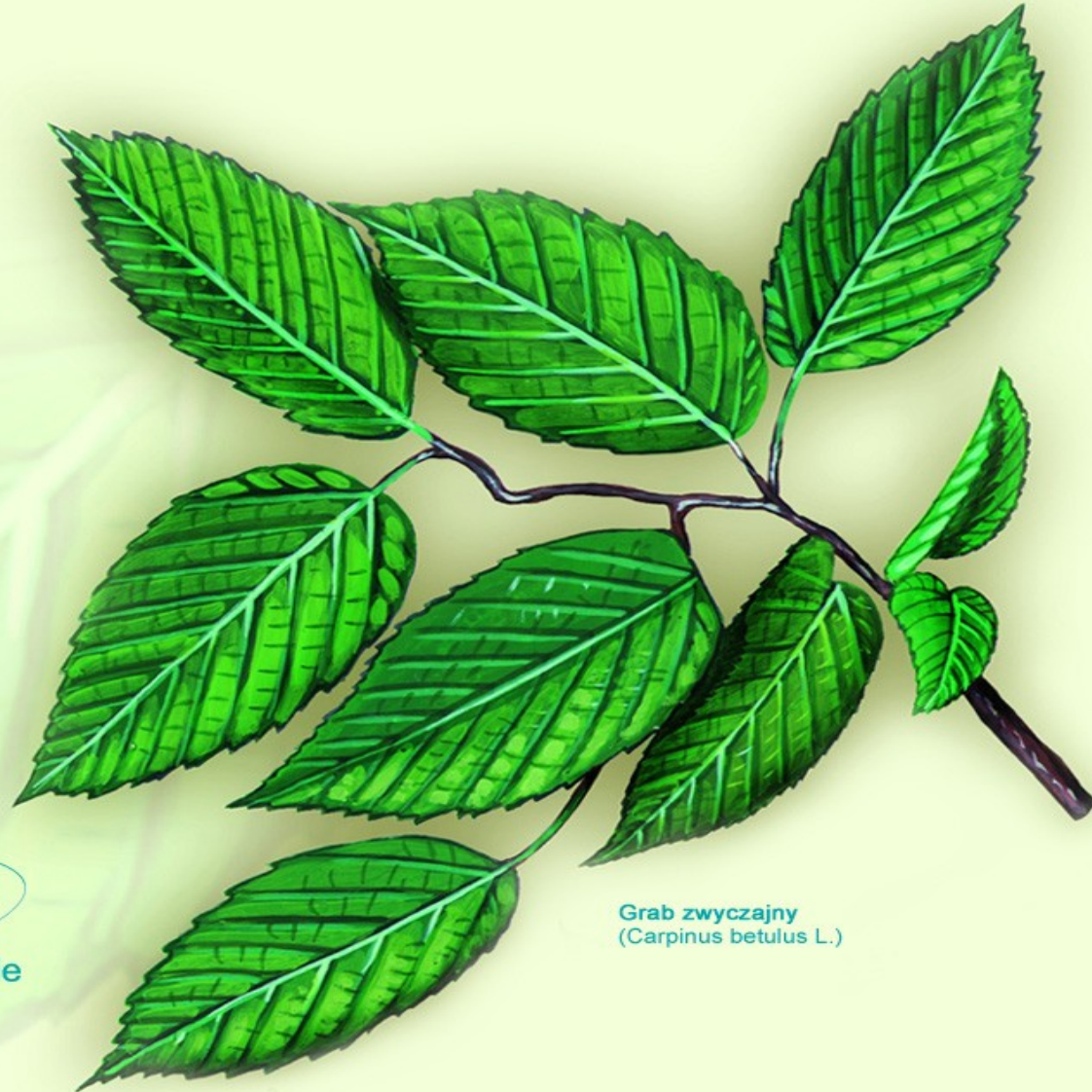
Grab zwyczajny ( Carpinus betulus L.)